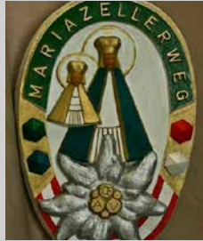
Wandererabzeichen, Basilika Marizell