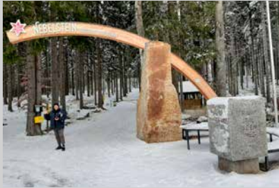
Granitwürfel am Beginn des Nord-Süd-Weitwanderweges 05, Nebelstein

Es ist nicht bloß die „handwerkliche“ Tätigkeit Carl Hermanns, mit der er zur Entstehung des Nord-Süd-Weitwanderweges 05 beiträgt; vielmehr reiht er Werke – wie Perlen an einer Schnur – aneinander und platziert seine Kunst entlang der Wegstrecke.